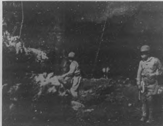
LOS EXPLORADORES DE MARIANAO EN COJIMAR. —Buscando el tesoro enterrado en la Cueva del Gato.

11.—Clausurado el Salón los señores expositores deberán recoger sus obras en un plazo no mayor de quince días después de