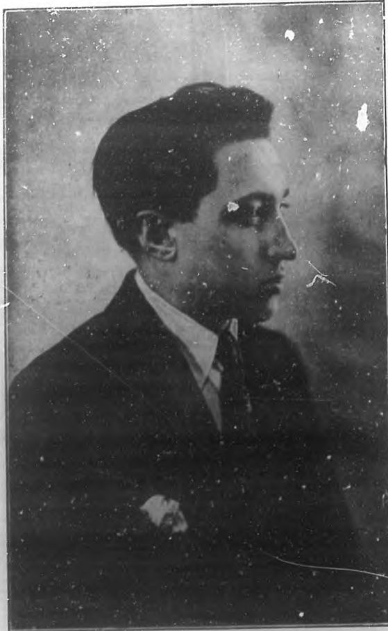
JOSE MARIA UNCAL Notable poeta, autor del libro "Los Poemas Cantábricos".

Así su alma es arpa que vibra delicadamente, cuando sus sensibles cuerdas son acariciadas por sus dedos ungidos con el óleo de la fe y trémulos por la inquietud que despierta en los espíritus superiores, el ansia insaciable de infinito, de lo eternamente misterioso y químérico.