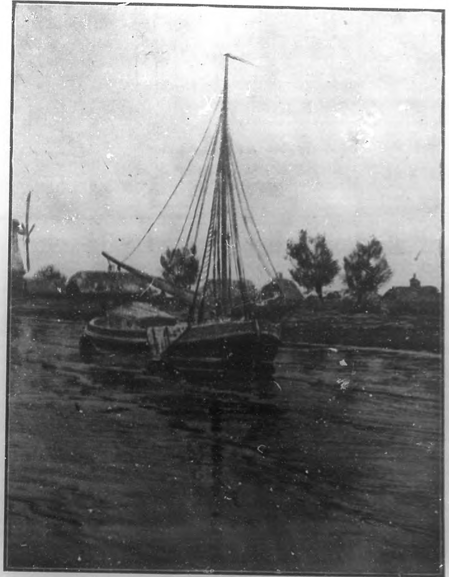
BARCA PESCADORA Cuadro de C. M. Wolf.

En el soneto sobre todo, este rimador de estrofas pulidas, sonoras y víviles, es ya un maestro, componiéndolo irreprochable