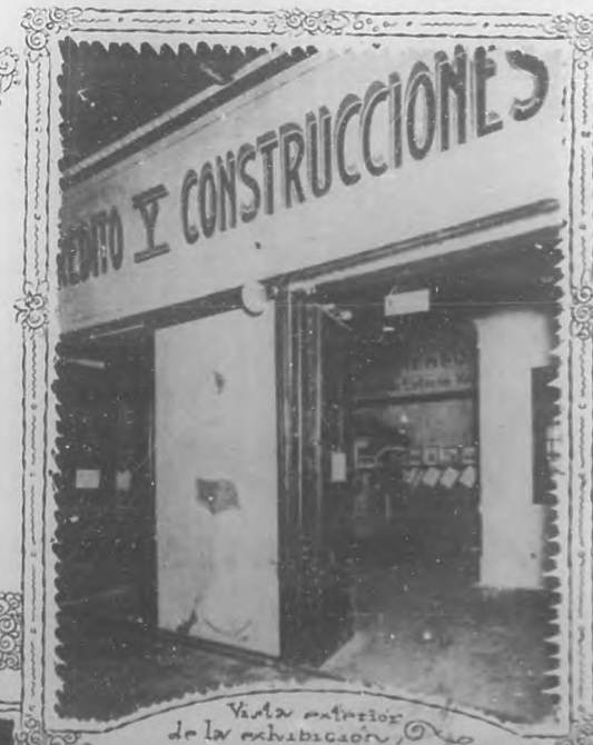
Vista exterior de la exhibición.

Un pedazo a tamaño natural de una construcción "Sistema Aguado", por la