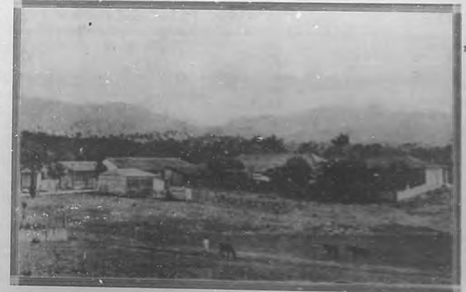
SAN DIEGO DE LOS BAÑOS. —Bellísimo panorama en los alrededores del pueblo.

Actualmente, el doctor Cabarroú dispone de casas particulares para aquellas personas que prefieran ir de temporada con toda la familia y la servidumbre, y deseen disfrutar de la independencia y las ventajas del hogar propio. Esas casas están acondicionadas con todo el servicio sanitario, agua abundante, luz eléctrica y garage, para arrendar a precios módicos, compatibles con la situación. Si las familias que tomen estas casas desean obtener el servicio de comidas del Hotel, éste se lo proporciona.