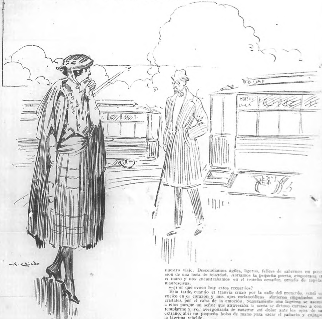
POR ROSARIO SANORES

—¿Por qué evoco hoy estos recuerdos? Esta tarde, cuando el tranvía cruzó por la calle del recuerdo, sentí un vuelco en el corazón y mis ojos melancólicos sintieron empujados sus cristales, por el vaho de la emoción. Seguramente una lágrima se asomó a ellos porque un señor que atravesaba la acera se detuvo curioso a contemplarme y yo, avergonzada de mostrar mi dolor ante los ojos de un extraño, abrí mi pequeña bolsa de mano para sacar el pañuelo y enjugar la lágrima rebelde.