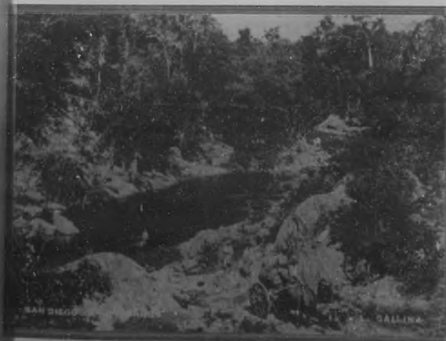
SAN DIEGO DE LOS BAÑOS. —Vista de parte del río donde se encuentra el manantial "La Gallina".

Si se hace el viaje por la carretera central, los paisajes que se ofrecen a la vista de los viajeros desde que se pasa el Caimito son de por sí solos merecedores del viaje."