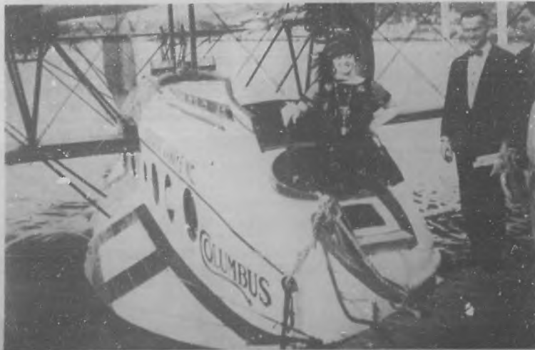
La gran cantante Margueritte Silvia llegando a la Habana en el hidroplano "Columbus", el día 1.º del actual.

UNA POPULAR EMPRESA EN LA EXPOSICION COMERCIAL